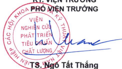
TS. Ngô Tắt Thắng